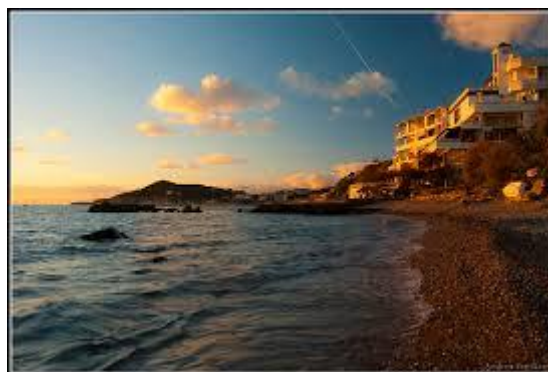
Punta falcone 1