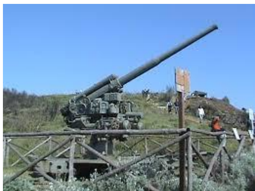
Mappa promontorio di Piombino

10 Settembre 2017 18° Congresso regionale della Toscana