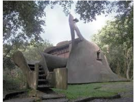
Casa della balena