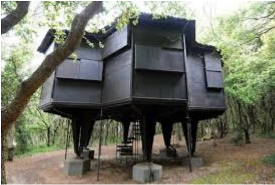
Casa dell'esagono 1

10 Settembre 2017 18° Congresso regionale della Toscana