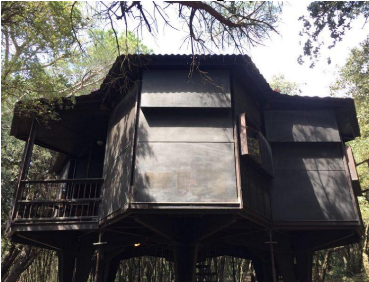
Casa dell'esagono 2

Chi ha partecipato all'assemblea, al termine della stessa, potrà partecipare ad una passeggiata fotografica nella pineta di Baratti